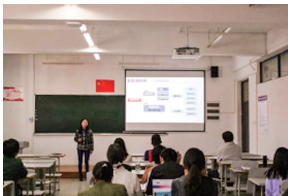
青年教师说课比赛