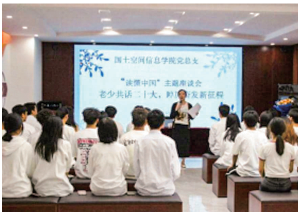
“老少共话二十大，踔厉奋发新征程”座谈会

重点参加学习教育的党员干部全覆盖，实现师资共享、上下联动“学思想”“强党性”的好格局；突出学习载体的鲜活性，各类学习活动内容丰富，形成了“多点连线面面结合”的良好学习聚合效应，推动各层面知行合一“重实践”“建新功”。期间，启动“青春正是读书时”网络主题活动；举行 2023 年“学思践悟二十大，砥砺奋进谱新篇”主题手抄报征集评选活动；“青春心向党，献礼二十大”心理征文比赛；举行“工匠精神进校园，砥砺奋斗铸青春”专题讲座等。