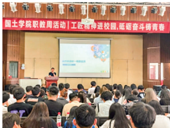
“工匠精神进校园，砥砺奋斗铸青春”专题讲座