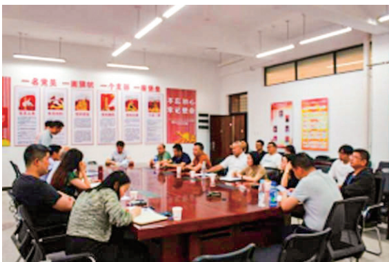
学院访企拓岗交流会

策和措施。邀请退休老党员、行业专家、“五一劳动奖章”获得者走进教室或云端连线开展“老少共话二十大，踔厉奋发新征程”座谈会、“讲光荣史，传优良校风”、“学生与就业”、“智