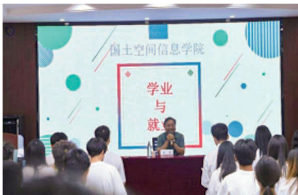
“学业与就业”指导专题讲座

策和措施。邀请退休老党员、行业专家、“五一劳动奖章”获得者走进教室或云端连线开展“老少共话二十大，踔厉奋发新征程”座谈会、“讲光荣史，传优良校风”、“学生与就业”、“智